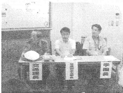
(交通安全高齢者大学校・学長代理として)